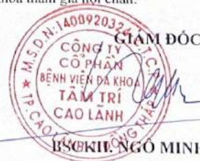
BS CKII NGÔ MINH NGHĨA