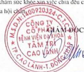
BSCKII NGÔ MINH NGHĨA